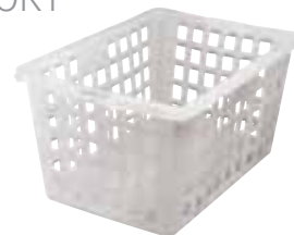
Cesta pane impilabile, polietilene Bread basket, stackable, LLDPE Brot-Korb, stapelbar, LLDPE Corbeille à pain, empilable, LLDPE Cesta pan, apilable, LLDPE