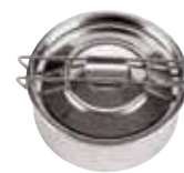
Pietanziera, inox Food container, stainless steel Speisenbehälter, 18-10 Edelstahl Porte-manger, inox Contenedor comida, inox

Incluso spazzolino per la pulizia, serie di etichette Latte, Caffè e Tè in 5 lingue. - Included into the package cleaning brush and labels set Milk, Coffee and Tea in 5 languages.