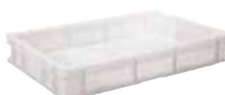
Contenitore sovrapponibile, HDPE Stackable container, HDPE Behälter, stapelbar, HDPE Conteneur empilable, HDPE Contenedor apilable, HDPE