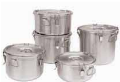
Contenitore isotermico, inox AISI 304 Insulated container, stainless steel Thermobehälter, Edelstahl Rostfrei Conteneur isotherme, inox Contenedor isotérmico, inox