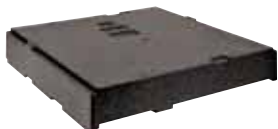
BASE E COPERCHIO BASE AND LID 44975-50