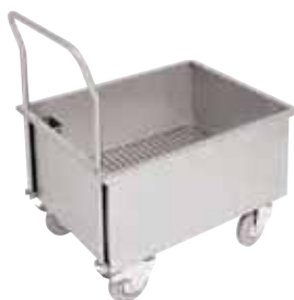
Carrello vasca, inox Sink trolley, stainless steel Obst/Gemüsewaschwagen, Edelstahl Rostfrei Chariot à evier, inox Carro-cuba lavado verduras, inox