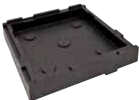
BASE E COPERCHIO BASE AND LID 44975-50

Contenitore isotermico PIZZA Insulated container Thermobehälter Conteneur isotherme Contenedor isotérmico