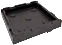
BASE E COPERCHIO BASE AND LID 44975-35

Contenitore isotermico PIZZA Insulated container Thermobehälter Conteneur isotherme Contenedor isotérmico