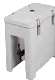
Distributore di bevande isotermico Insulated beverage dispenser Isolierte Getränkebehälter Conteneur isotherme avec robinet Contenedor isotérmico con grifo