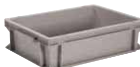
Contenitore sovrapponibile, HDPE Stackable container, HDPE Behälter, stapelbar, HDPE Conteneur empilable, HDPE Contenedor apilable, HDPE