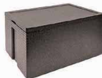
Contenitore isotermico per pasticceria Insulated pastry box Konditorei-Thermobehälter Conteneur isotherme à pâtisserie Contenedor isotérmico