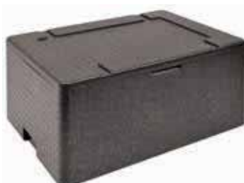
Contenitore isotermico UNIVERSAL PN Insulated container Thermobehälter Conteneur isotherme Contenedor isotérmico