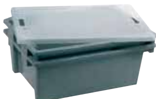
Contenitore con coperchio Space saving box with cover Behälter mit Deckel Réceptier avec couvercle Contenedor con tapa