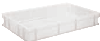
Contenitore sovrapponibile, HDPE Stackable container, HDPE Behälter, stapelbar, HDPE Conteneur empilable, HDPE Contenedor apilable, HDPE