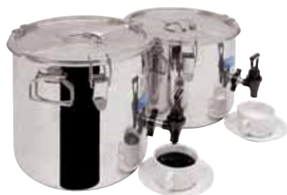
Contenitore isotermico GN 1/1 Insulated container GN 1/1 Thermobehälter GN 1/1 Conteneur isotherme GN 1/1 Contenedor isotérmico GN 1/1