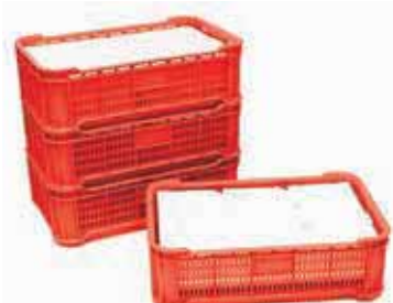
Cesto gastronorm, PP Gastronorm basket, PP Gastronorm-Korb, PP Panier gastronorme, PP Cesta gastronorm, PP