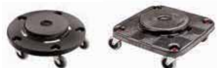
Supporto mobile, PE Dolly, PE Wagen, PE Chariot, PE Soporte móvil, PE