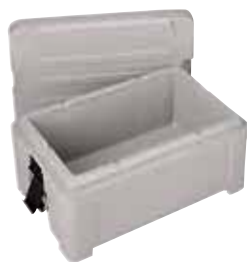
Contenitore isotermico GN 1/1 Insulated container GN 1/1 Thermobehälter GN 1/1 Conteneur isotherme GN 1/1 Contenedor isotérmico GN 1/1