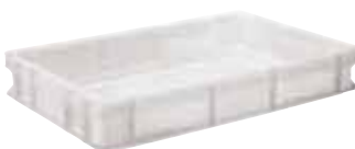
Contenitore sovrapponibile, HDPE Stackable container, HDPE Behälter, stapelbar, HDPE Conteneur empilable, HDPE Contenedor apilable, HDPE