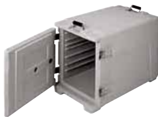
Contenitore isotermico GN 1/1 Insulated container GN 1/1 Thermobehälter GN 1/1 Conteneur isotherme GN 1/1 Contenedor isotérmico GN 1/1