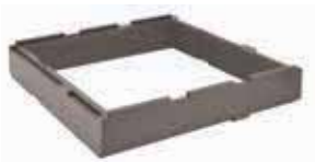
ESTENSORE EXTENDER 44975H50